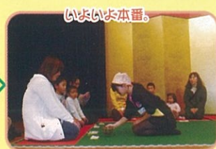
てまろ 結構なお点前でした!!