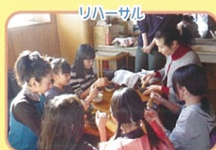
夏休み「ジュニアスタッフのお茶会」