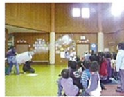
空気砲であそぼう

時間 60分 対象 親子・小学生 ※1人100円 手作りの液や枠の製作と、大きなシャボン玉を体験します。 (期間：4～10月)