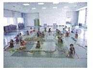
ドミノであそぼう

時間 90～120分 対象 親子・小中学生 ドミノで作った作品を繋げて最後は倒して遊びます。