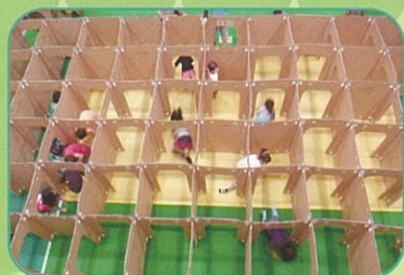
写真は前回実施の様子です