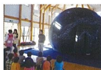
移動プラネタリウム「にこっとドーム」

通常のプログラムとは別枠で、移動プラネタリウム「にこっとドーム」や、地元で活躍する各団体のステージを楽しめる鑑賞事業も実施しています。こちらは日程等詳細が決まり次第、関係団体へお知らせしますので、ぜひご応募ください。