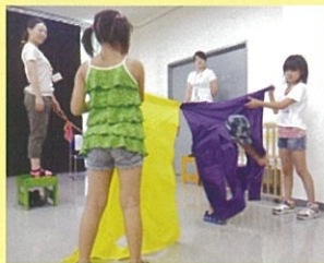
夏休み 「ジュニアスタッフの忍者屋敷」

夏休みやお正月行事のお手伝いの他、自分達で企画する催し物もあります。家や学校ではできない体験もたくさんあります。興味のあるお友だちはぜひご参加ください。