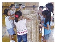
カブラであそぼう

時間 90～120分 対象 親子・小中学生 カブラ(白木の積み木)を使って、高さ積み競争、かまくら、ニアガラなどに挑戦します。