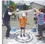
シャボン玉であそぼう

時間 90分 対象 小中学生 静電気を利用した、実験と工作を行います。 (期間：12～2月)