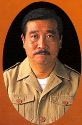
早稲田大学教授 吉村 作治