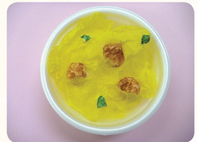
おやこどん 親子丼