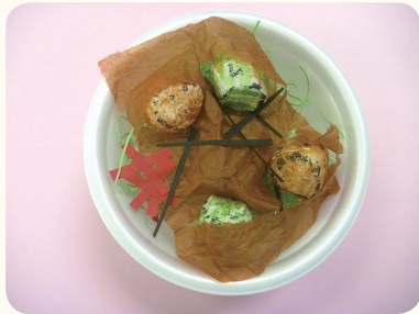
や とりどん 焼き鳥丼