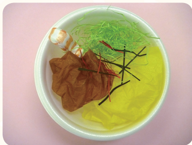
さんしよくどん 三色丼