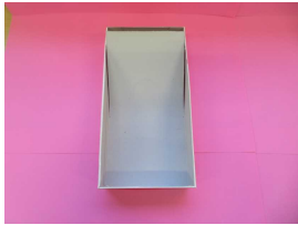
ティッシュボックス