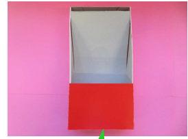
どこ 底はセロハンテープではる